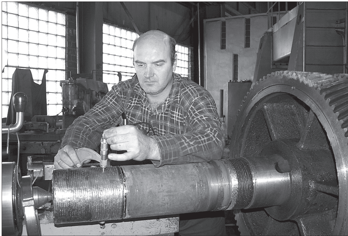
Ямалу нужны высококвалифицированные рабочие.

Социум | Предложение полпреда президента в УрФО Игоря Холманских о восстановлении системы трудовых наград в России воплотилось в жизнь